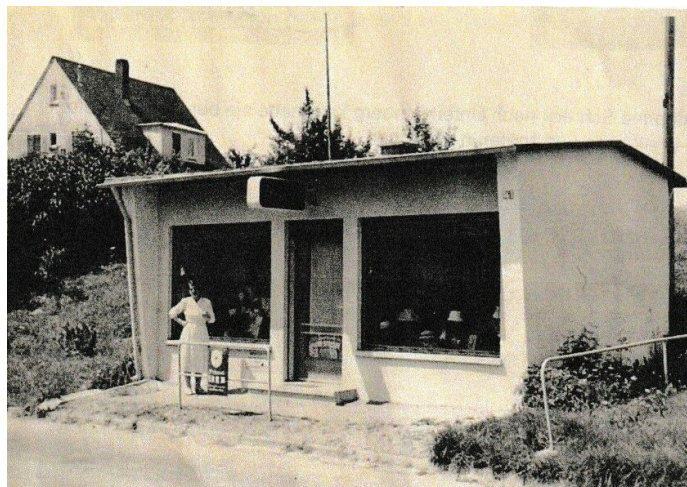
Das markante Haus in der Hauptstraße (gegenüber Nr. 53 und unterhalb "Im Fälle")

Das weiche Seidenpapier, in das die Hüte der Firma Mayser eingepackt waren, war für einige Kunden eine beliebte Alternative zum damals noch oft verwendeten Zeitungspapier, um es rücklings zu verwenden.