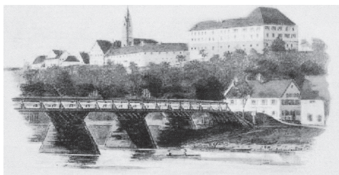
Die 1945 gesprengte Illerbrücke, rechts das Gasthaus „Hirsch“

Doch kaum schwiegen die Waffen, wurde die Bevölkerung in einen noch größeren Schrecken versetzt! Wie ein Lauffeuer verbreitete sich die Kunde, dass Oberkirchberg zerstört und zusammen geschossen werden solle. Viele Einwohner luden daher ihre Habseligkeiten auf Handwagen und versuchten, in Richtung Beutelsch und in den umliegenden Wäldern Schutz zu finden.